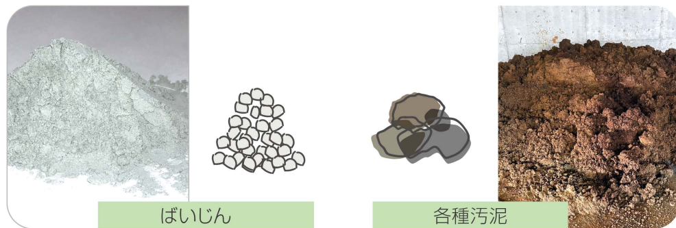
廃棄物を再生土としてリサイクル

※ 受入条件の詳細については、福山営業所または営業担当者まで、お問い合わせください。